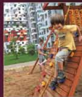
Двор без машин