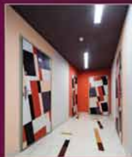
Авторский дизайн интерьеров