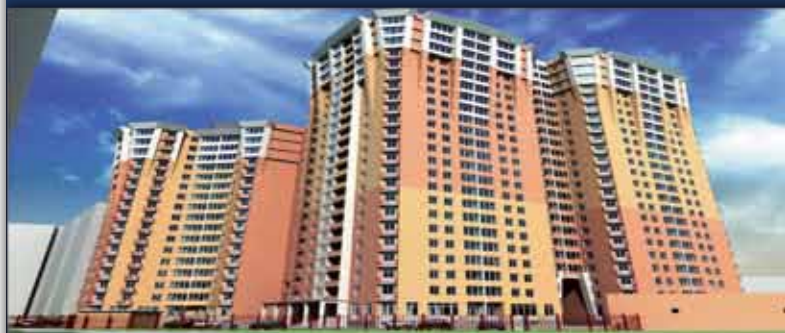
ЖК "Балтийский Квартет" м. Сходненская, б-р Яна Райниса д. 31 Дом сдан ГК.

При реставрации гостиничного комплекса «Пекин» и застройке прилегающей территории были обнаружены редкие археологические находки. Работы на площадке проводились компанией «Археологические изыскания в строительстве» с марта 2013 года. За два месяца раскопок найдено более 350 артефактов XVI-XX веков, среди которых уникальные изразцы XVII-XIX веков, а также предметы обихода, ремесленные изделия из кожи и дерева, сохранившиеся почти в первозданном состоянии. Все находки будут переданы в Музей истории Москвы. Компания «Галс-Девелопмент» намерена провести реставрацию, в результате которой гостинично-офисный комплекс «Пекин» будет отвечать современным требованиям. На прилегающей территории за гостиницей «Пекин» на участке 1,7 га появятся два корпуса на 352 апарт-мента и административное здание площадью 65,5 тыс. м 2 .