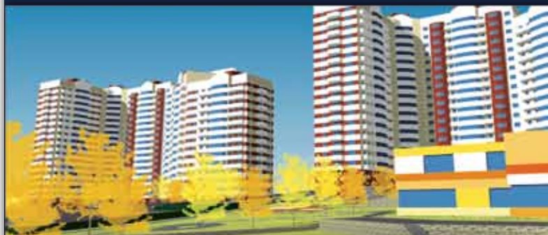
ЖК "Заречная Слобода" в г. Ивантеевка: начало строительства 9 корпуса. Комфортные условия и доступные цены!