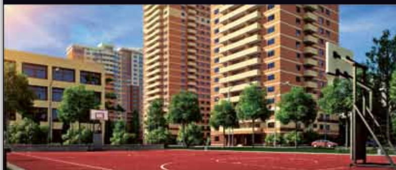
ЖК "Весенний" в Подольске 17 км. от МКАД 214 ФЗ.