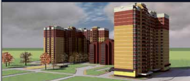
ЖК "Ультрамарин" в Лосино-Петровском 29 км. от МКАД 1-корп. сдан ГК.