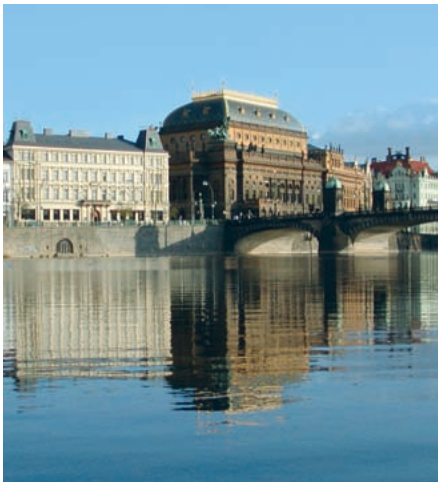
Национальный театр, расположенный у моста Легии, — помпезное, в стиле империи Габсбургов, здание.

рец есть, но ничего не стоит пройти мимо, не заметив его.