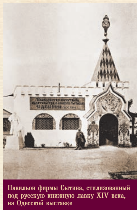
Павильон фирмы Сытина, стилизованный под русскую книжную лавку XIV века, на Одесской выставке

женера В. Г. Шухова (автора знаменитой телебашни на Шаболовке) был построен грандиозный полиграфический комплекс — наилучший не только в России, но и в Европе. Сытин заполнил его супероборудованием, а технику он любил и лелеял, так что в Москве его даже прозвали Американцем (когда он одним из первых в городе купил автомобиль). В корпусах, как муравьи, без устали трудились две с половиной тысячи рабо-