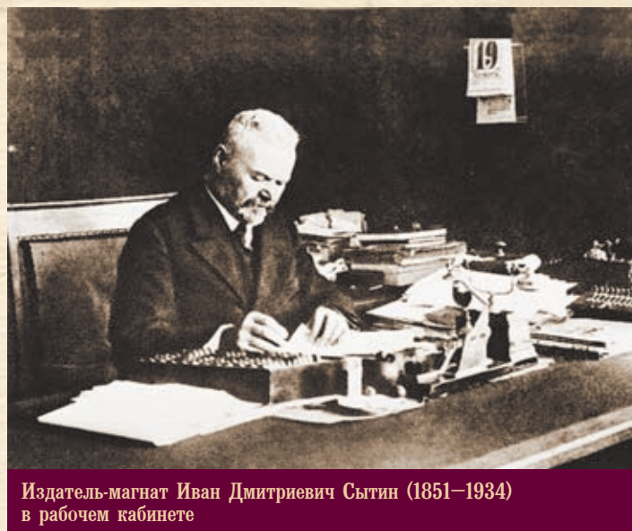
Издатель-магнат Иван Дмитриевич Сытин (1851–1934) в рабочем кабинете