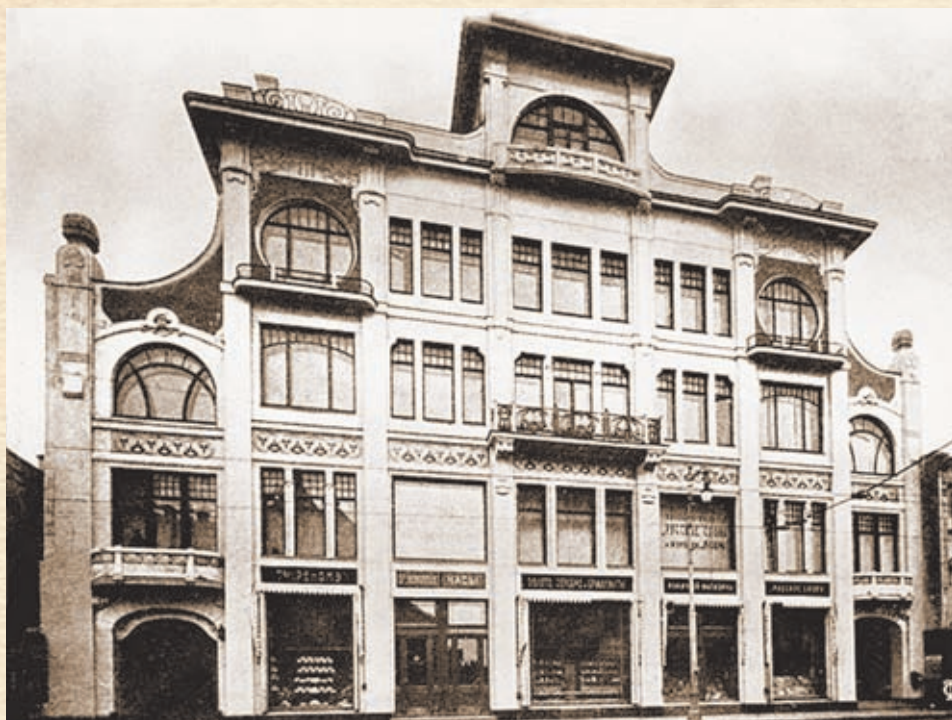
Дом газеты «Русское слово» на Тверской. Архитектор А.Э. Эрихсон

скинского промысла) и Живаго соседние участки. На земле (участок буквой «Г» площадью 7553 м 2 выходит на Тверскую улицу и Путинковский переулок) в 1905 году строится типография из двух корпусов во дворе. Площадь подземных подсобных помещений составляет 572 м 2 . По своему обыкновению Сытин максимально «начиняет» здание новейшей техникой, которую обслуживают 240 рабочих. Оборудование уникальное, такого в России больше нет: несколько ротационных машин Augsburg и Marinoni стоимостью по 25 тыс. руб. каждая, которые способны выдавать по 1824 тыс. листов в час, наборные машины Linotype — 75 тыс. листов в час. Стоимость всего оборудования составляла к 1913 году 405 тыс. руб. В 1905 году тираж «Русского слова» достиг 157 тыс. экземпляров. Стало ясно, что дело пошло.