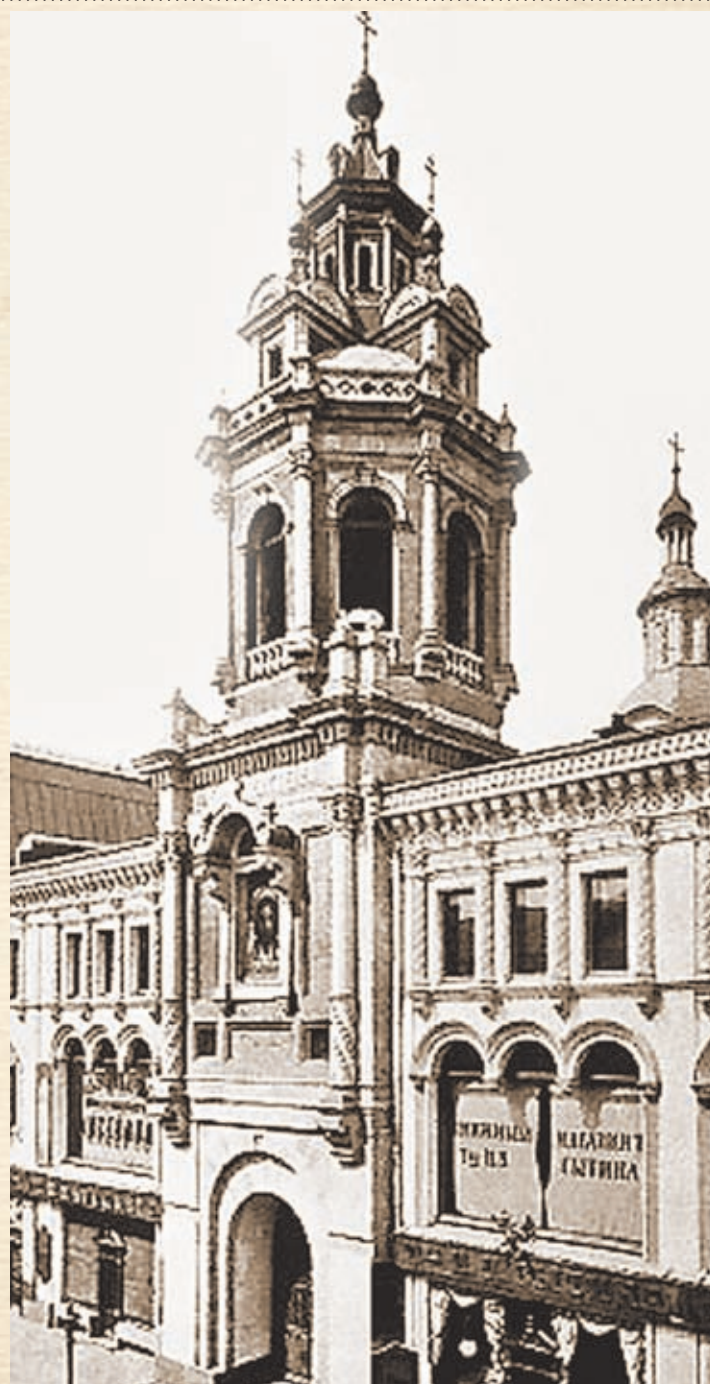
Магазин И.Д. Сытина в колокольне Греческого подворья на Никольской

подмечал и анализировал. В своих «Заметках об Америке» он с пафосом написал, обращаясь к родной стране и сравнивая ее с молодой Америкой: «Долго, крепко спал наш мужик. Встань, проснись, посмотри на себя: ведь соседи твои работают давно, младшая сестра твоя — Америка — сделала чудеса. Ты [Россия] — старшая сестра, у тебя просторы необъятные, благодать сокровищ везде и во всем, а ты прокормить умело и сытно себя не можешь». Что тут скажешь? Знал Сытин, что говорил. А сытинская недвижимость и в наши дни — не памятник ушедшей эпохе, а здания престижные, функциональные, радующие глаз. Так и бывает, когда целеустремленная личность мыслит широко и смотрит далеко вперед. PH