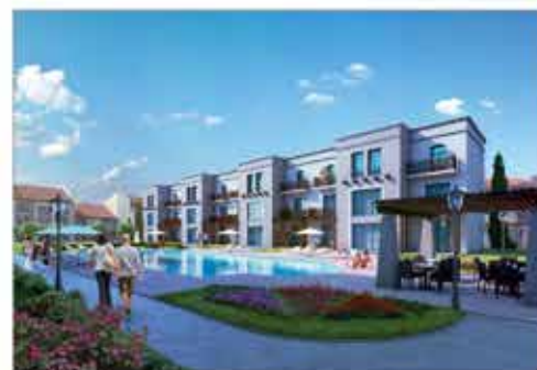
"Итальянская деревня в Крыму", "Капри"