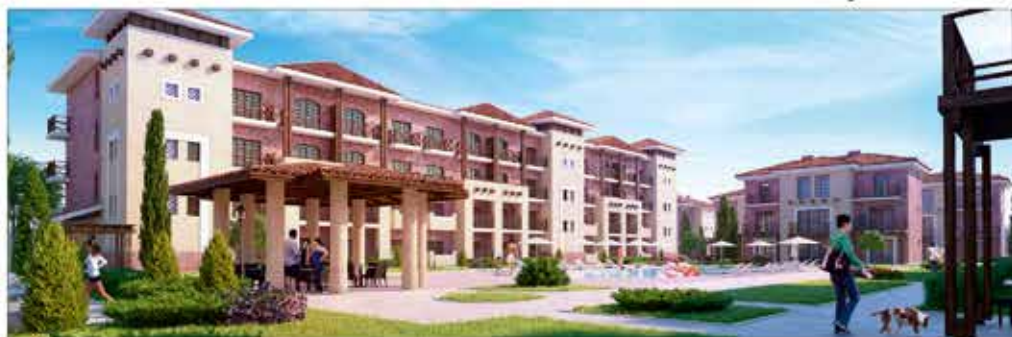
"Итальянская деревня в Крыму", "Палермо"