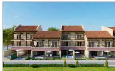
Комплекс таунхаусов "Тарханкут Life"