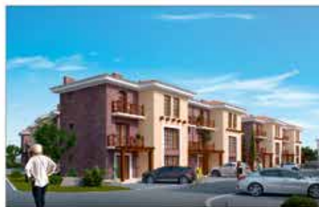
Коттеджный комплекс "Солнце и море"