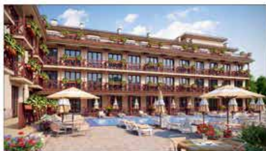
Клубный комплекс "Черноморский"