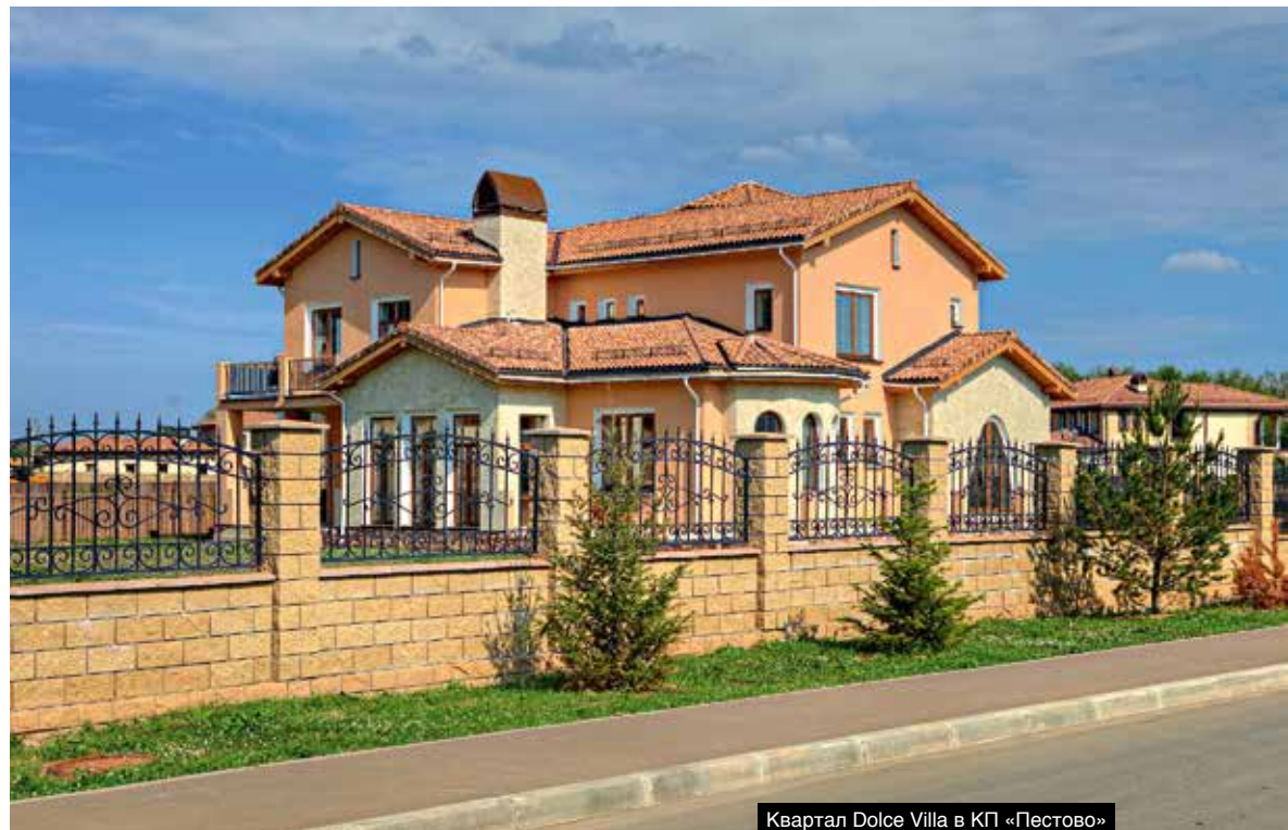
Квартал Dolce Villa в КП «Пестово»

ОТДЫХ НА ДОРОГОМ ЕВРОПЕЙСКОМ КУРОРТЕ — ПРИЯТНОЕ ВРЕМЯПРОВОЖДЕНИЕ: УМИРОТВОРЯЮЩАЯ АТМОСФЕРА, ЖИВОПИСНЫЕ ПЕЙЗАЖИ, ПРЕКРАСНЫЙ СЕРВИС И ИНТЕРЕСНО ОРГАНИЗОВАННЫЙ ДОСУГ. СОБСТВЕННИКАМ ДОМОВ В ЭЛИТНОМ ПОСЕЛКЕ «ПЕСТОВО» ПОВЕЗЛО: ОНИ КРУГЛЫЙ ГОД ЖИВУТ НА ЭКСКЛЮЗИВНОМ КУРОРТЕ.