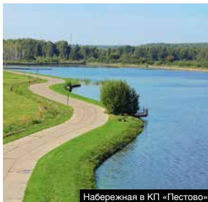
Набережная в КП «Пестово»

Жизнь у «большой воды» заманчива не только для владельцев яхт и катеров. Приятно в теплый денек провести время на песчаном пляже, купаться, полюбоваться солнечными бликами на воде.