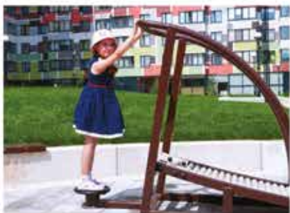
уличные тренажеры (Маршала Тухачевского, 49)

П ри проектировании квартала особое значение уделялось заботе о маленьких жителях. Поэтому здесь предусмотрено все необходимое для всестороннего и гармоничного развития малышей. На территории квартала много детских игровых площадок, беговых дорожек, уютных прогулочных мест для отдыха, а уличные спортивные площадки Open Air позволяют заниматься спортом на свежем воздухе! Двор жилого комплекса полностью изолирован от автомобилей. Вечером вся территория красиво подсвечивается, поэтому в любое время суток дети чувствуют себя здесь в безопасности.