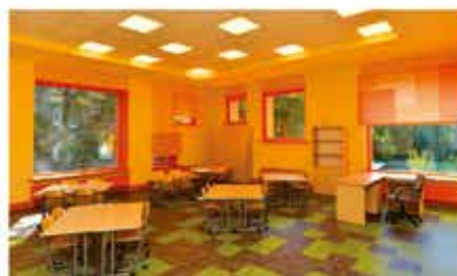
удобные классы для групповых занятий