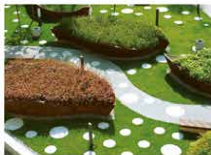
ландшафт двора (Маршала Тухачевского, 41)

Н а территории квартала построена Хорошевская прогимназия, к созданию которой были привлечены российские и европейские специалисты в области архитектуры, образования и детской психологии. Уникальный для России проект совмещает в себе функции детского сада и начальной школы и задуман, как социально-культурный семейный центр, где кроме образовательных и спортивных программ, будут представлены творческие студии, технические кружки, бассейн с секцией синхронного плавания, консультации психологов.