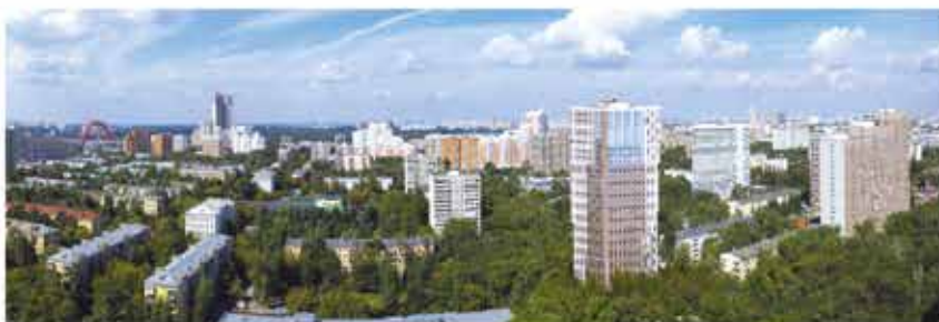
панорамный вид на квартал Union Park

К вартал Union Park – яркий, современный, комфортный – он сразу же стал символом обновления района, достопримечательностью, которая собирает восхищенные взоры. Это территория энергичных и деловых людей, ценящих свое время, увлеченных работой, заботящихся о покое семейного очага. В настоящее время ведется строительство нового жилого дома, такого же эффективно, как предыдущие здания. При отделке фасадов применяется клинкерный кирпич с декоративными штукатурными вставками. Здесь будет тепло и уютно в любое время года. Интерьеры и инженерное оснащение нового дома, также как и всего жилого комплекса, соответствует самому высокому качеству. В Union Park применяются технологии, которые используются в фешенебельных отелях мира.