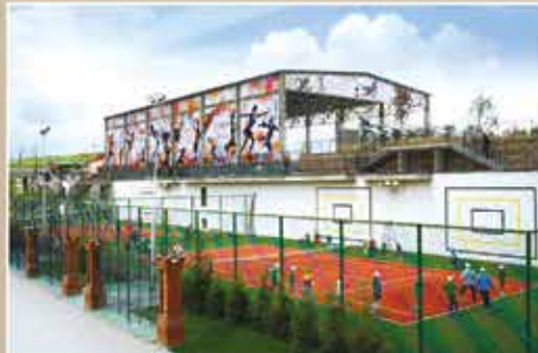
Профессиональные теннисные корты