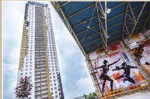
Ледовый каток и роллердром