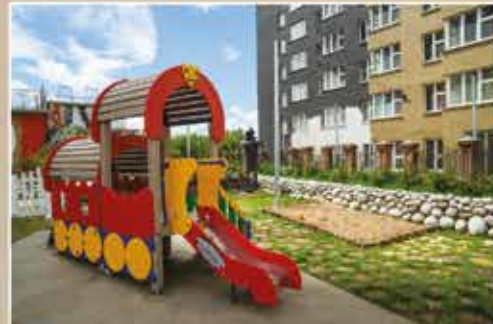
Детские игровые площадки