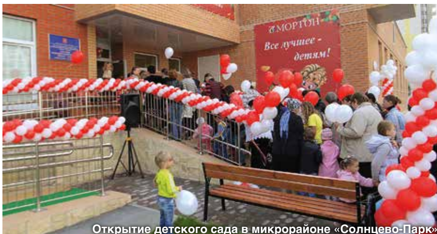
Открытие детского сада в микрорайоне «Солнцево-Парк»

Некоторые из проектов строятся по госконтрактам с Министерством