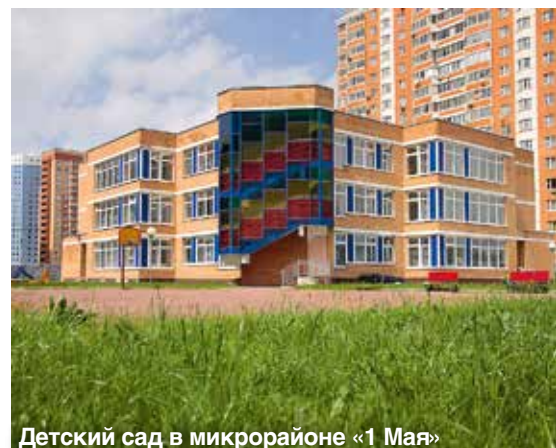
Детский сад в микрорайоне «1 Мая»