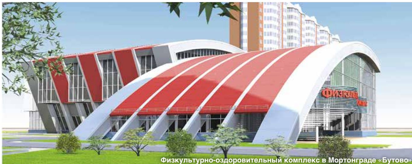
Физкультурно-оздоровительный комплекс в Мортонграде «Бутово»