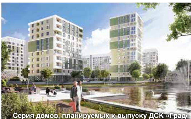
Серия домов, планируемых к выпуску ДСК «Град»