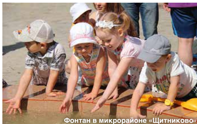
Фонтан в микрорайоне «Щитниково»

обороны, Госнарконтролем, внутренними войсками РФ и другими силовыми структурами. Кроме того, «Мортон» практикует и завершение долгостроев: силами компании сданы в эксплуатацию один из старейших долгостроев в Нахабино, дом на Леновском шоссе в Балашихе, ЖК «Медвежья озера» в Щелковском районе. В данный момент достраивается микрорайон «Овражный» в Щербинке с общей площадью жилья более 200 тыс. м 2 .