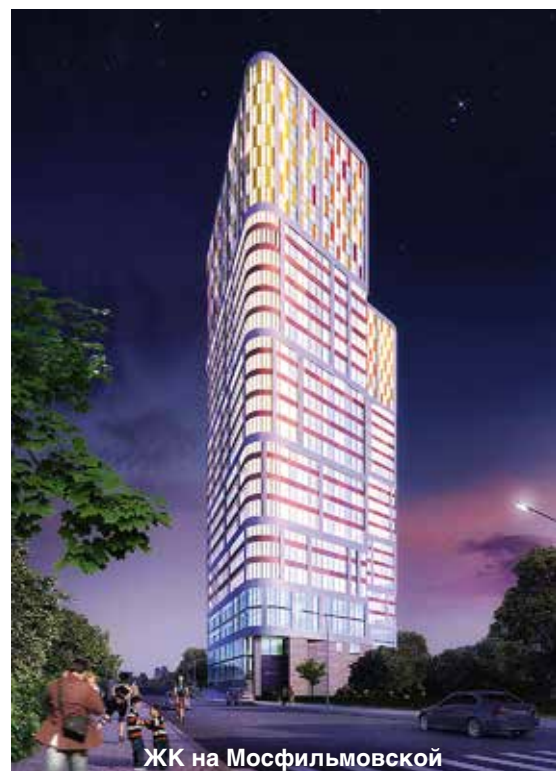
ЖК на Мосфильмовской

На пике второй волны кризиса 2008–2009 гг. застройщик не останавливает ни одну свою стройку в Московской области — более того, начинает возведение первого монолитно-кирпичного жилого комплекса в Москве, на ул. Лечебной, по индивидуальному проекту, разработанному собственной архитектурной мастерской. В тот же период «Мортон» выигрывает госконтракт на реализацию проекта микрорайона для военнослужащих и членов их семей. Уже к концу 2011 года построен и сдан микрорайон Авиаторов (30-й микрорайон) — 480 тыс. м 2 жилья с развитой инфраструктурой, который на сегодняшний день считается одним из самых благоустроенных районов подмосковной Балашихи.