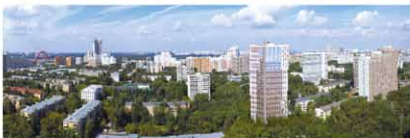
панорамный вид на квартал Union Park

К вартал Union Park – яркий, современный, комфортный – он сразу же стал символом обновления района, достопримечательностью, которая собирает восхищенные взоры. Это территория энергичных и деловых людей, ценящих свое время, увлеченных работой, заботящихся о покое семейного очага. В настоящее время ведется строительство нового жилого дома такого же эффективного, как предыдущие здания. Новый корпус представляет собой монолитный дом оригинальной треугольной формы. При отделке фасадов применяется клинкерный кирпич с декоративными штукатурными вставками. В таком доме будет тепло и уютно в любое время года. Интерьеры и инженерное оснащение нового дома также, как и всего жилого комплекса соответствует самому высокому качеству. В Union Park применяются технологии, которые используются в жилых комплексах и фешенебельных отелях мира.