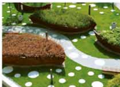
ландшафт двора (Маршала Тухачевского, 41)

Н а территории квартала построен новый детский образовательный центр, к созданию которого были привлечены российские и европейские специалисты в области архитектуры, образования и детской психологии. Уникальный для России проект совмещает в себе функции детского сада и начальной школы и задуман, как социально-культурный семейный центр, где кроме образовательных и спортивных программ, будут представлены творческие студии, технические кружки, бассейн с секцией синхронного плавания, консультации психологов.