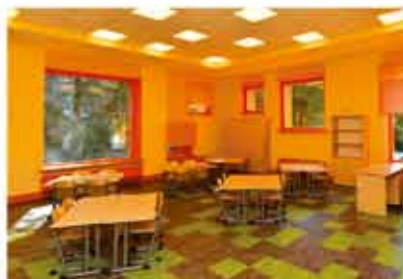
удобные классы для групповых занятий

Уникальность квартала Union Park состоит не только в прекрасной архитектуре, красивых интерьерах и развитой инфраструктуре. Самая лучшая награда для мастера – это когда его творение побуждает в человеке желание. Здесь хорошо людям разных возрастов. Именно в этом состоит секрет успеха!