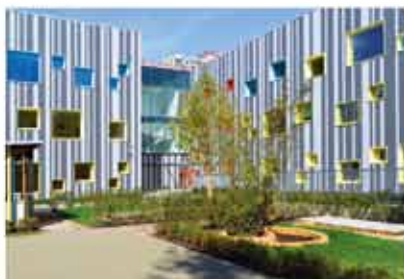
фасад детского образовательного центра

Н а территории квартала построен новый детский образовательный центр, к созданию которого были привлечены российские и европейские специалисты в области архитектуры, образования и детской психологии. Уникальный для России проект совмещает в себе функции детского сада и начальной школы и задуман, как социально-культурный семейный центр, где кроме образовательных и спортивных программ, будут представлены творческие студии, технические кружки, бассейн с секцией синхронного плавания, консультации психологов.