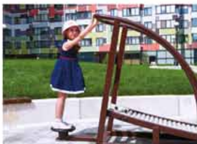
уличные тренажеры (Маршала Тухачевского, 49)

П ри проектировании квартала особое значение уделялось заботе о маленьких жителях. Поэтому здесь предусмотрено все необходимое для всестороннего и гармоничного развития малышей. На территории квартала много детских игровых площадок, беговых дорожек, уютных прогулочных мест для отдыха, а уличные спортивные площадки Open Air позволяют заниматься спортом на свежем воздухе! Двор жилого комплекса полностью изолирован от автомобилей. Вечером вся территория красиво подсвечивается, поэтому в любое время суток дети чувствуют себя здесь в безопасности.