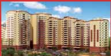
КОММУНАРКА-VII (корпус 2)

Срок сдачи Госкомиссии: III квартал 2013 г.