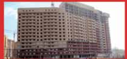
КОММУНАРКА-VII (корпус 1)

Срок сдачи Госкомиссии: IV квартал 2014 г.