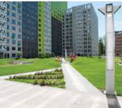
Двор без машин