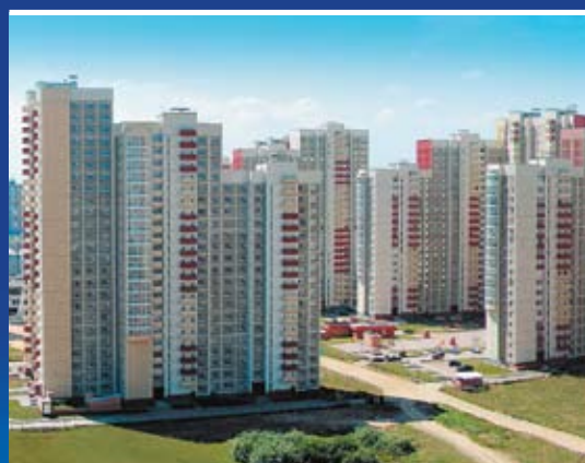
Жилой район «Новокуркино», г. Химки