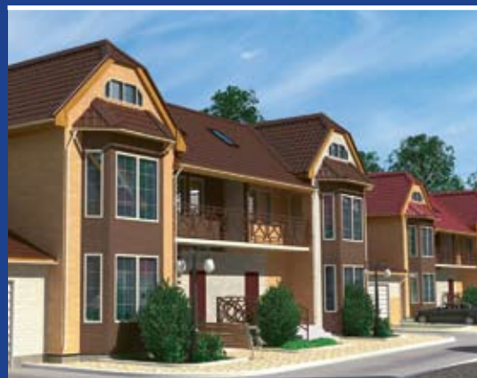
Поселок таунхаусов «Береговой», г. Долгопрудный