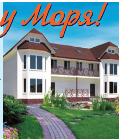
Клубный поселок «Мысхако», г. Новороссийск (Черное море)