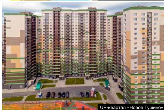
UP-квартал «Новое Тушино»

Абсолютно во всех своих проектах ФСК «Лидер» предлагает не только качественно построенные дома, но и продуманный до мелочей стиль жизни. Именно поэтому с ФСК «Лидер» выбрать квартиру и не ошибиться реально